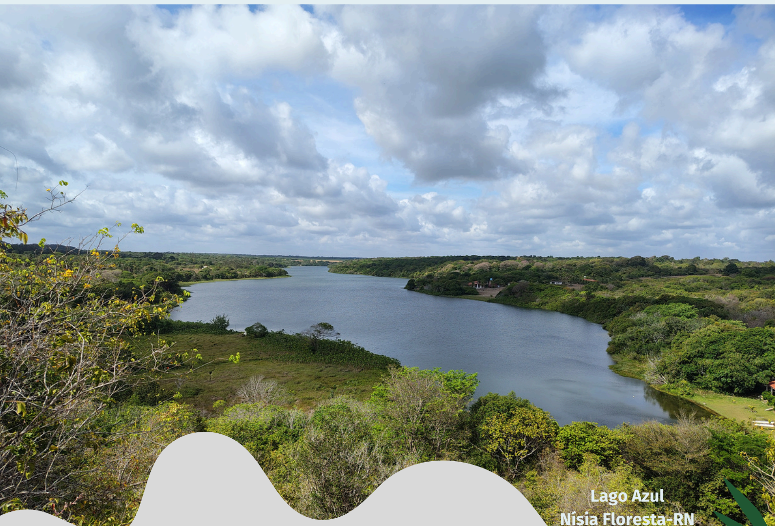
Lago Azul Nísia Floresta-RN

Circuito Potiguar de Orientação Nísia Floresta-RN - 8 de fevereiro de 2026